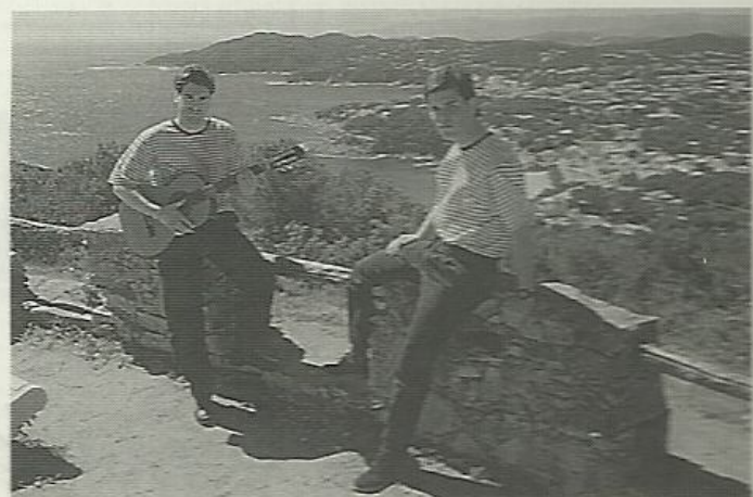
Grup Arjau des del Far de Sant Sebastià

De preparats se'ls veu i se'ls nota. Per cert, si Déu i el temps no ho impedeixen, els podreu escoltar aquest proper cap de setmana: el 10 de maig, al migdia, seran protagonistes a Ràdio Palafrugell, en directe, amb les seves cançons. Un dissabte d'havanera. La proposta és que no us ho perdeu.